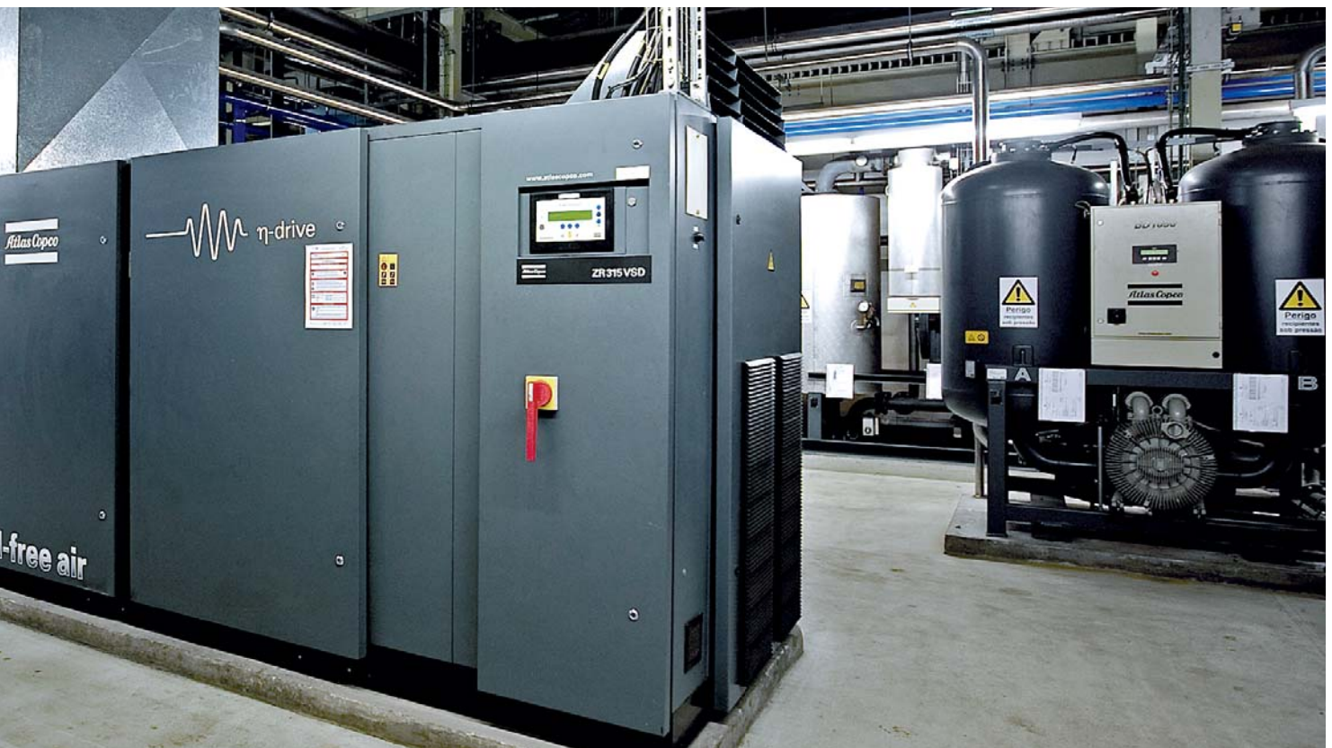
Atlas-Copco-Druckluftversorgung in mittelständischem Unternehmen