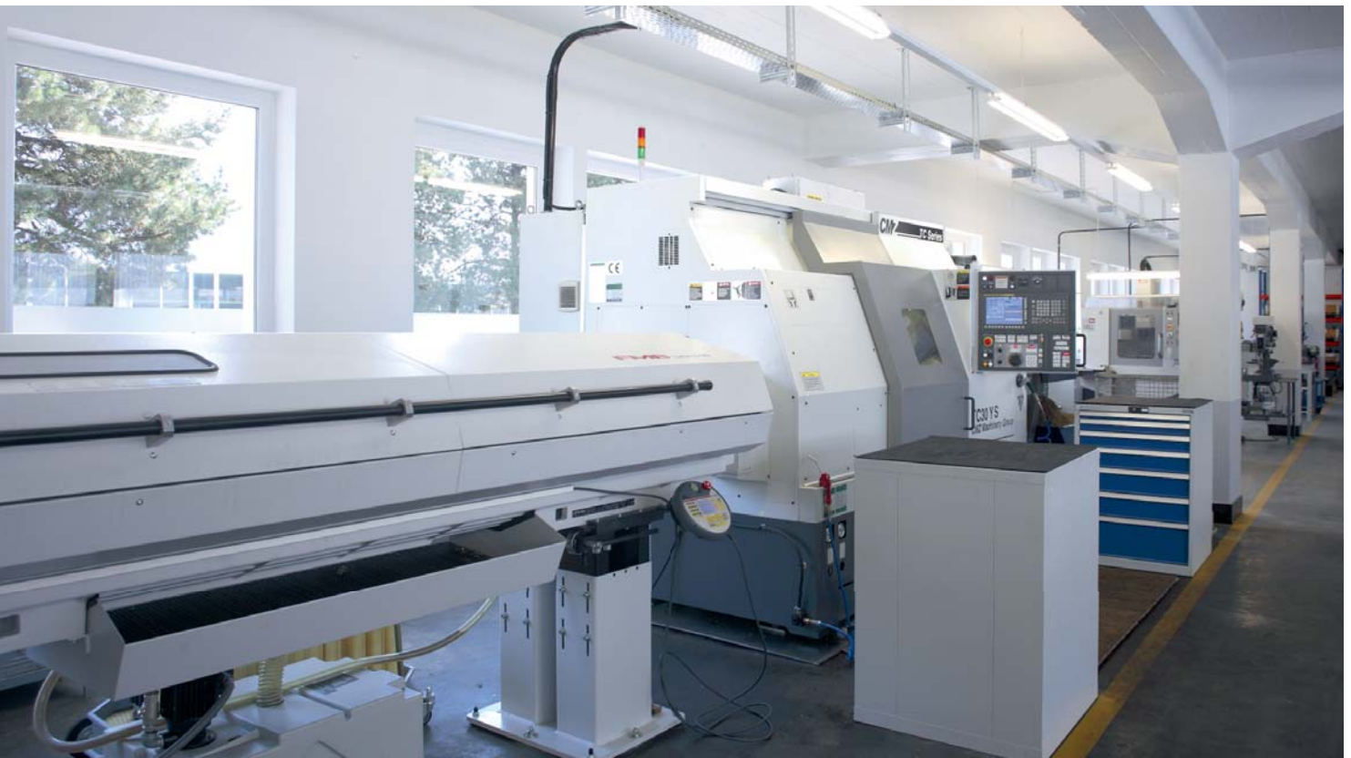
Fertigung mit CNC-Bearbeitung