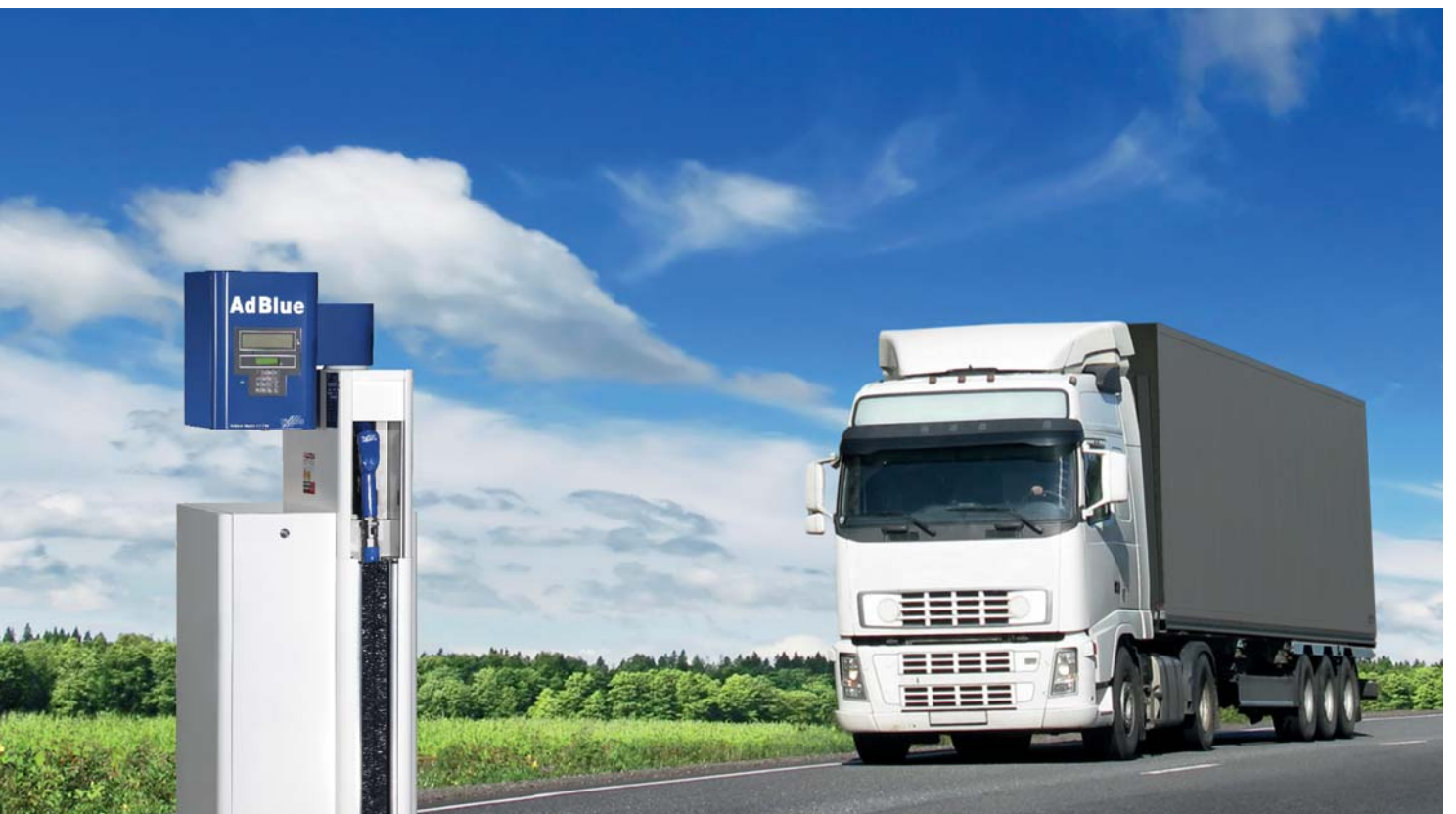
FLACO-Tank-Technik: für PKW, LKW oder Diesel-Loks