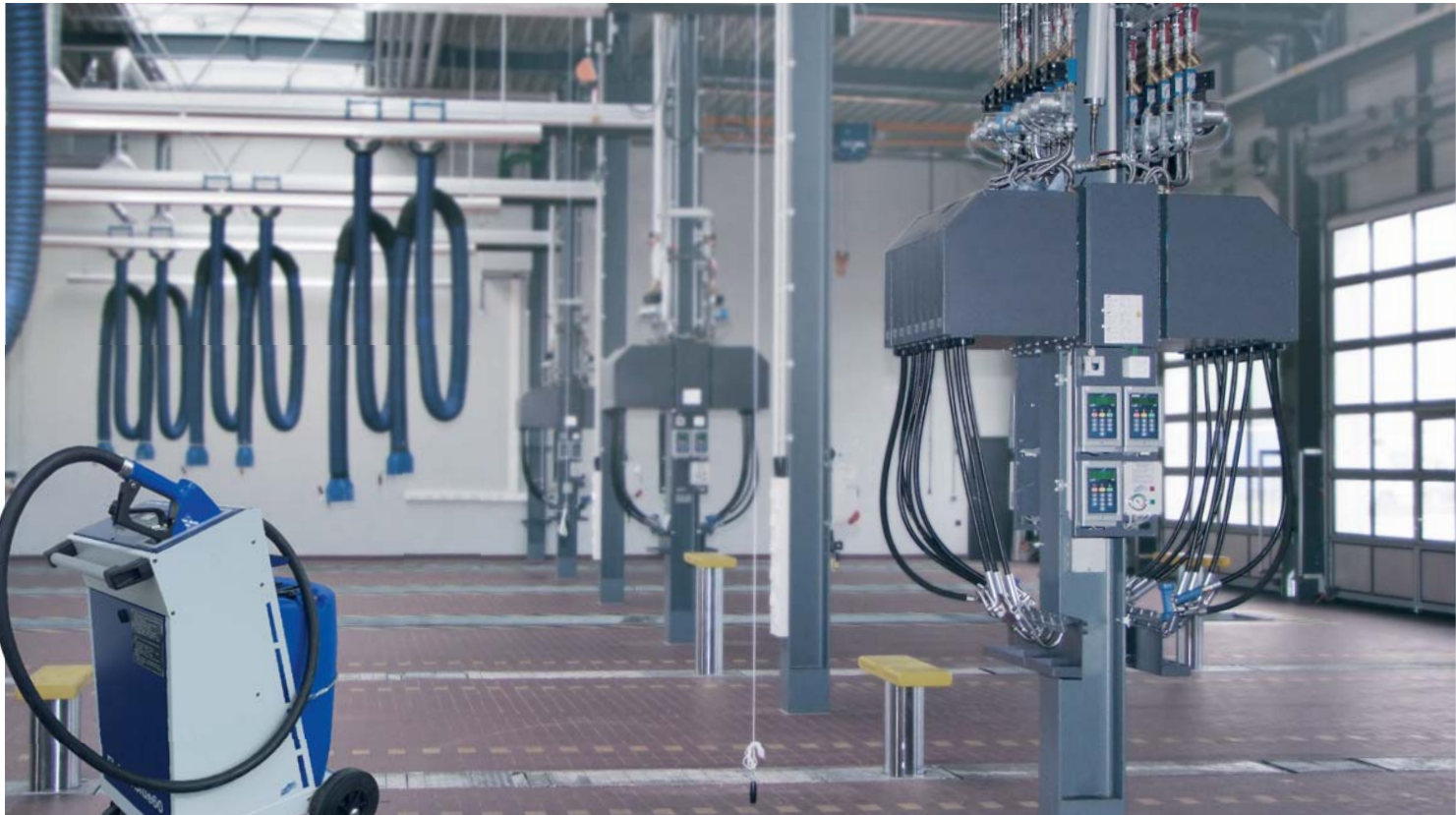
FLACO-Servicegeräte: unverzichtbar für moderne Werkstätten